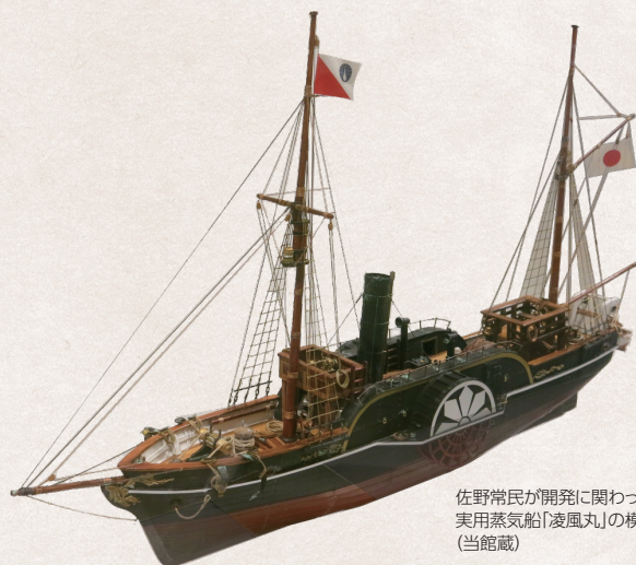
佐野常民が開発に関わった日本初の実用蒸気船「凌風丸」の模型(当館蔵)

1872(明治5)年、大隈重信が開通させた、日本最初の鉄道開業で走った蒸気機関車の模型。(当館蔵)