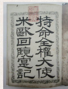
特命全権大使米欧回覧実記(当館蔵)