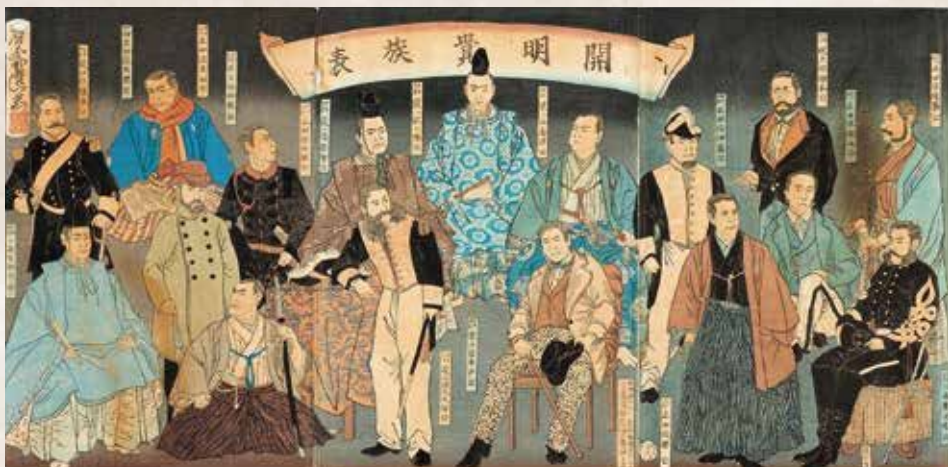
開明貴族表 1877(明治10)年 大隈は後列左から2番目

大隈重信記念館には、大隈重信の没後、そのご遺族や早稲田大学、市民の方から、貴重な資料や遺品などが多数寄贈されています。