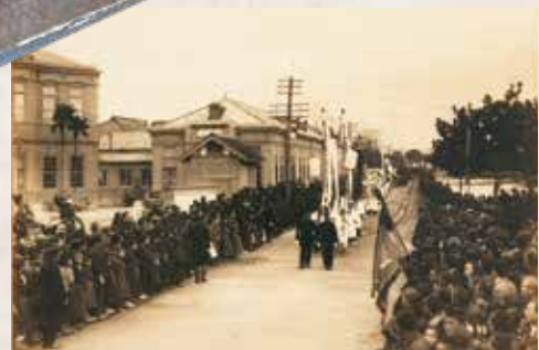
大隈重信県民葬 1922(大正11)年 佐賀城北濠付近