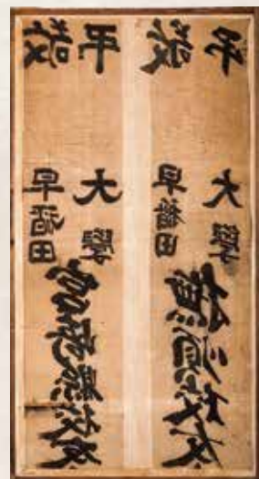
県民葬巡礼に使用されたのぼり旗