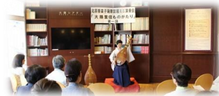
▲第一回目の様子 2019.4.6.開催