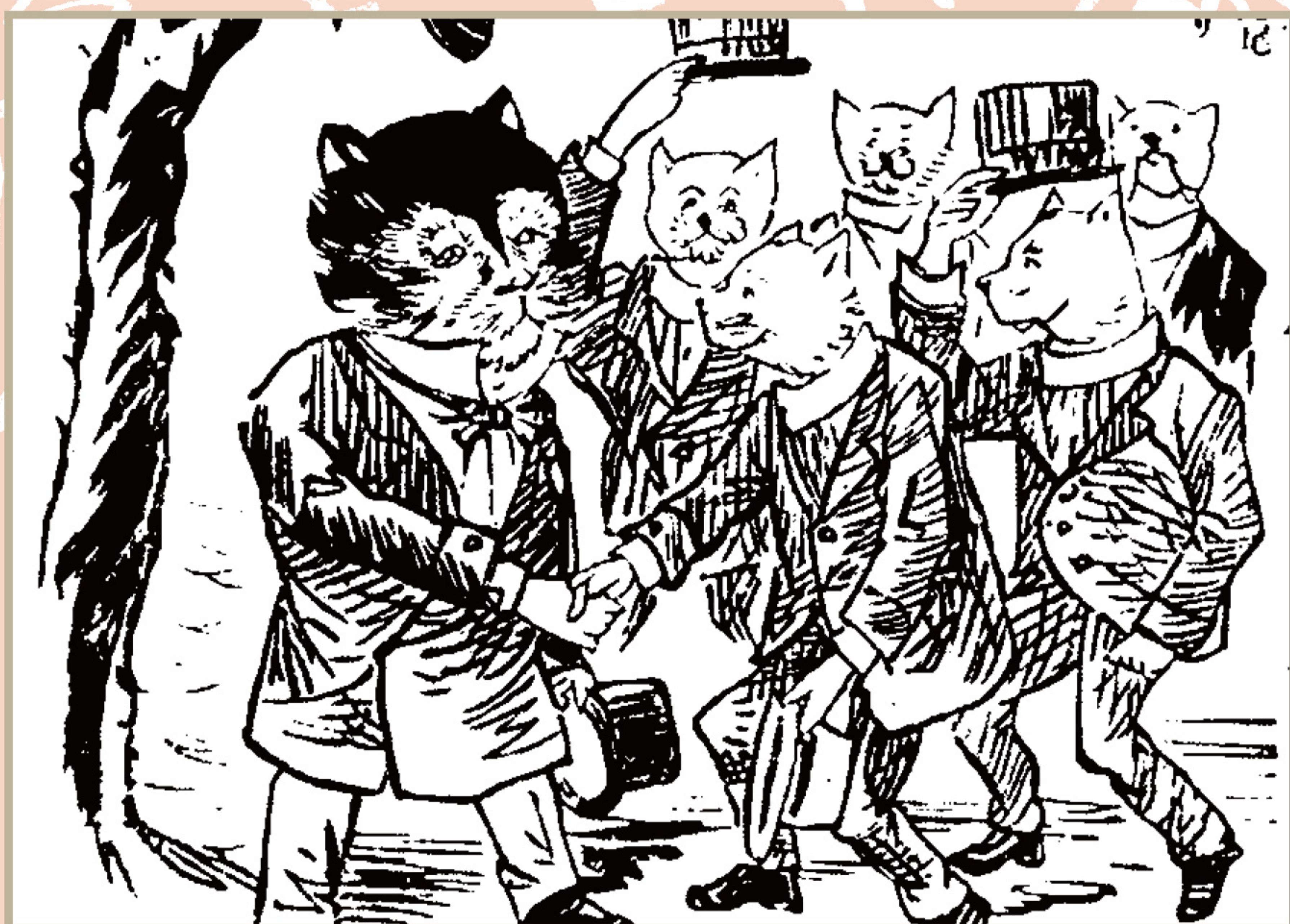
『下野する猫と猫一派』