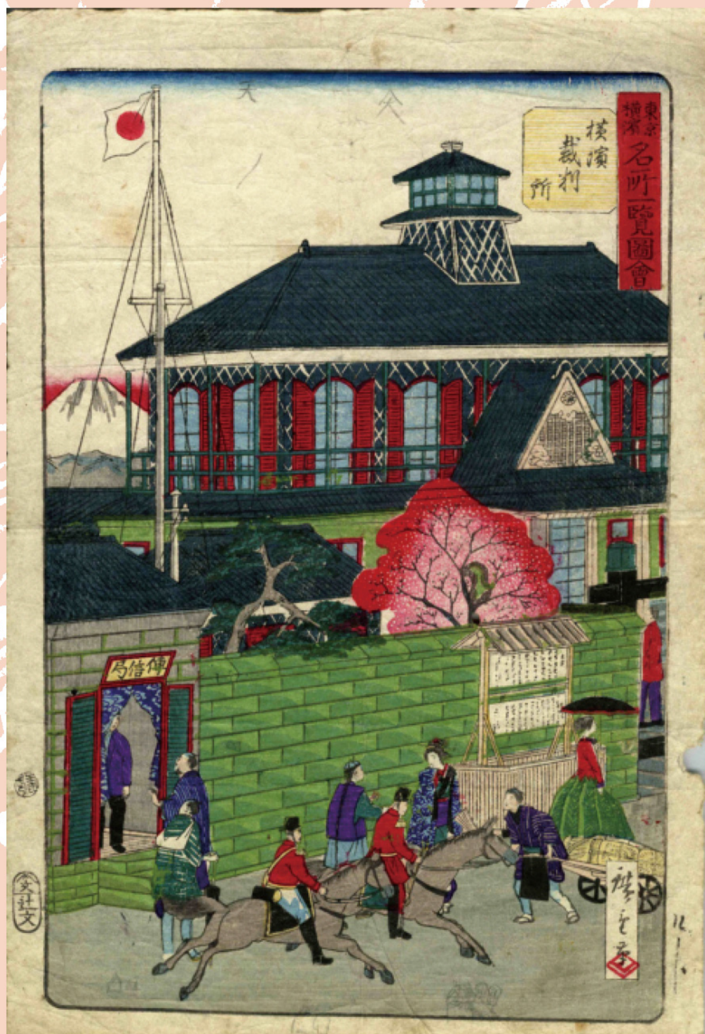
『東京横濱名所一覽圖會横濱裁判所』 神奈川県立図書館蔵