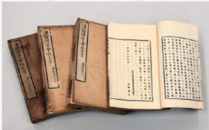
韓国博覧会報告書

本展では、大隈家に遺された手紙に焦点を当てるとともに、大隈の人物や時代背景などが分かる資料も紹介いたします。手紙を通して大隈と交流のあった佐賀の偉人たちとのふとした素顔を感じていただくと幸いです。