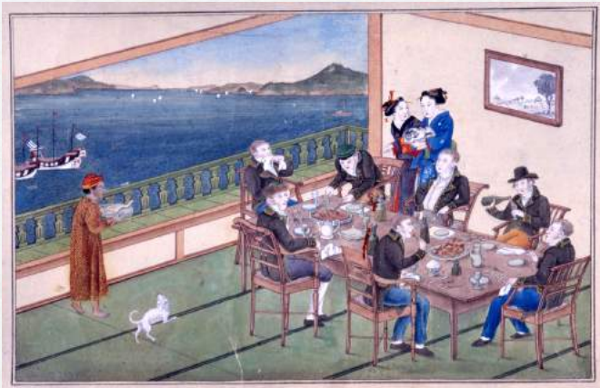
唐蘭館絵巻、蘭館図、宴会図 長崎歴史文化博物館 所蔵