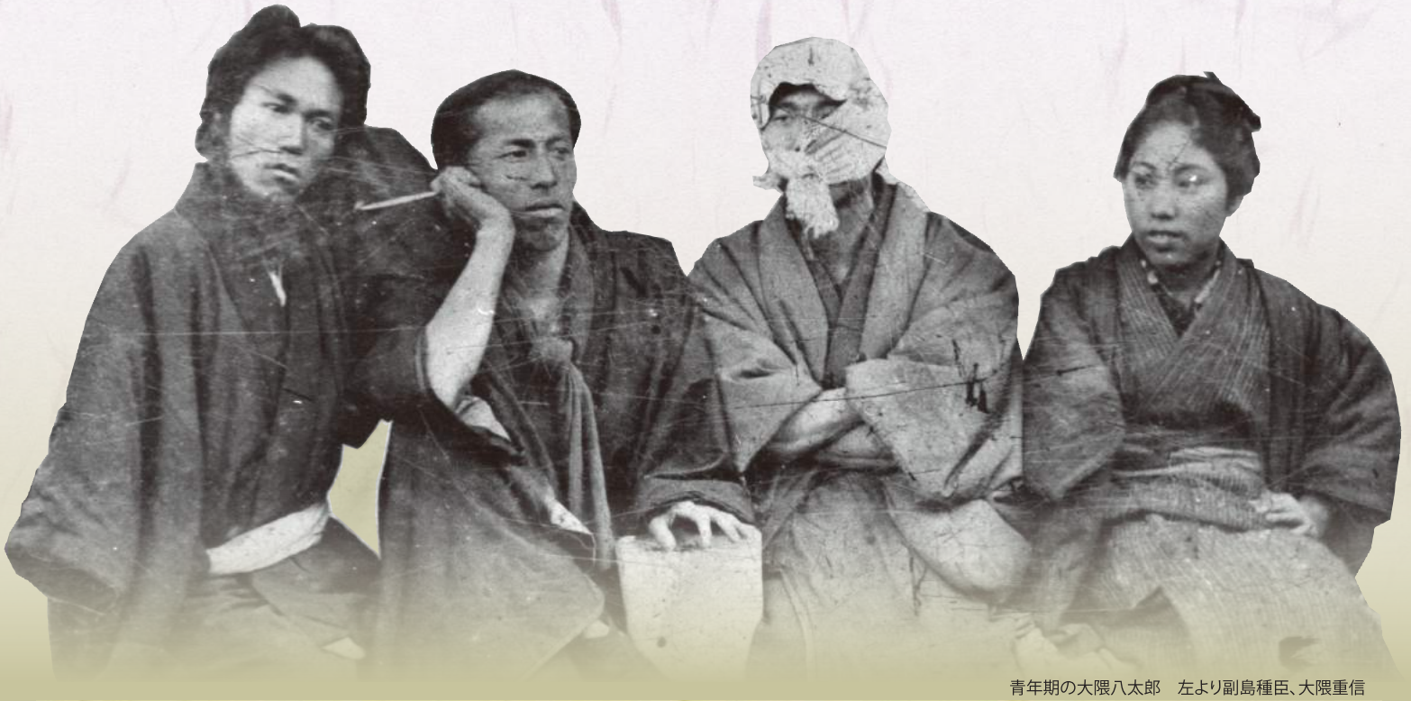
青年期の大隈八太郎 左より副島種臣、大隈重信